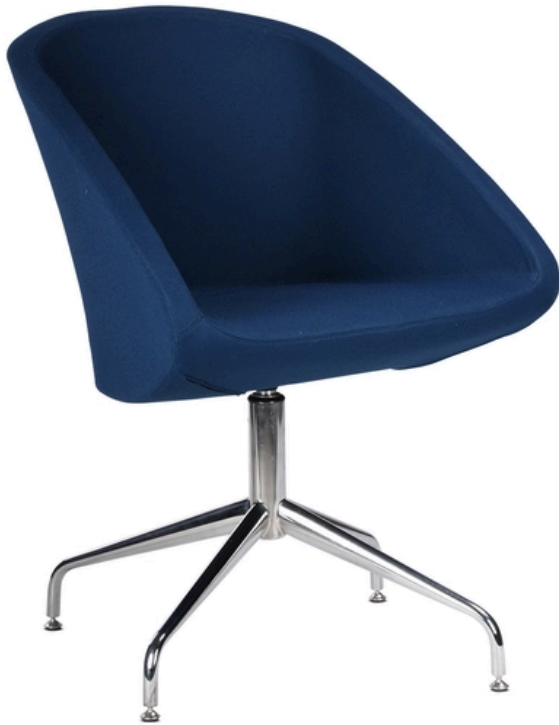
LA PHOTO PEUT INCLURE OPTIONAL

En considération du poids recommandé par ITALIAN SEDIOLITI. Pour les conditions de garantie, veuillez consulter les conditions générales de vente au commencement du listage.