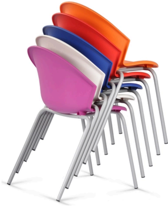
LA PHOTO PEUT INCLURE OPTIONAL