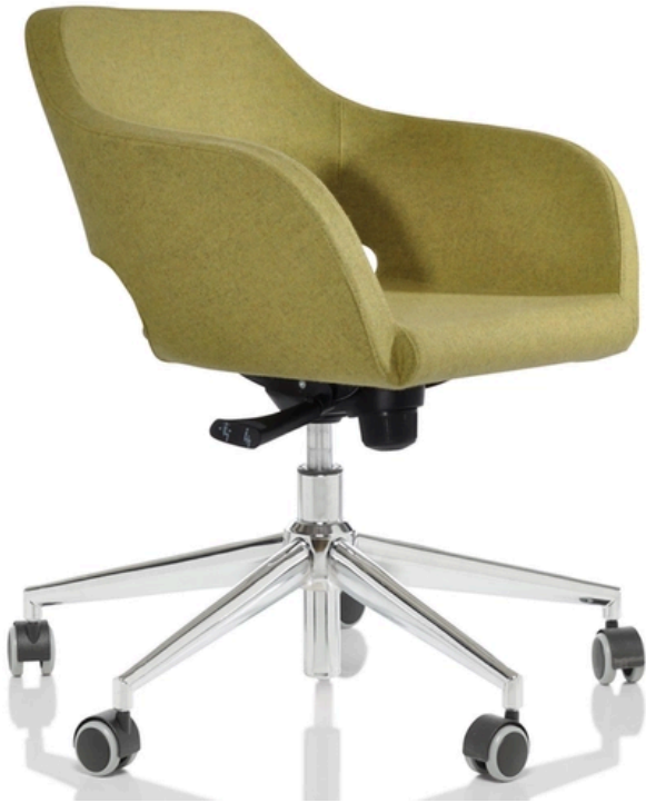
LA FOTO PUO' INCLUDERE OPTIONAL

La poltroncina Aria è progettata per offrire un perfetto equilibrio tra estetica e funzionalità, rendendola ideale per l'allestimento di sale d'attesa, aule meeting e spazi di lavoro contemporanei. Le linee morbide e avvolgenti della poltroncina Aria offrono non solo un'estetica piacevole, ma anche un comfort straordinario, grazie alla sua struttura ergonomica e ai materiali di alta qualità utilizzati. Nonostante il suo minimo spessore, la seduta garantisce un sostegno ottimale, risultando perfetta per lunghi periodi di utilizzo. La collezione si distingue per la possibilità di scegliere tra due diverse tipologie di basi: una base conica in acciaio, che conferisce un look moderno e industriale e una base a 5 razze, sinonimo di stabilità e praticità, perfetta per contesti operativi. Sia che si tratti di arredare spazi accoglienti per l'attesa, sia che venga utilizzata in contesti dinamici come le aule meeting, Aria si impone come una scelta sofisticata e funzionale, capace di arricchire ogni ambiente con classe e sobrietà.