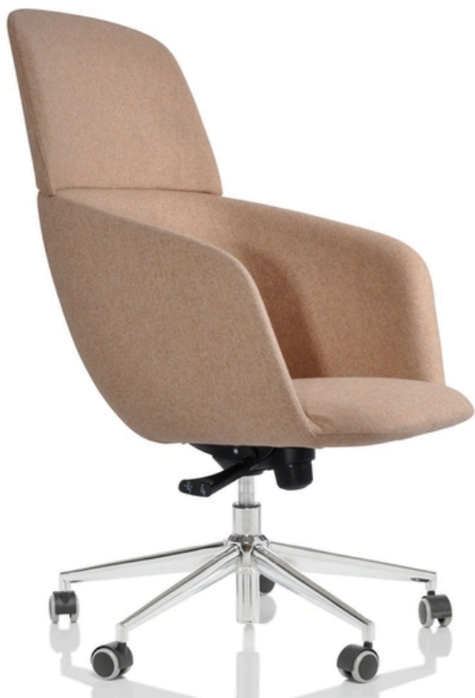
LA FOTO PUO' INCLUDERE OPTIONAL

Ogni dettaglio è stato attentamente curato per creare queste sedute eleganti e funzionali, che si distinguono per il loro minimo spessore che non compromette il massimo comfort, garantendo una seduta piacevole anche per periodi prolungati. Le due tipologie di basi - in acciaio conica e a 5 razze - permettono alla poltroncina Egg di arredare sale d'attesa e aule meeting in modo confortevole e accogliente. La base in acciaio conica conferisce un aspetto moderno e sofisticato, perfetta per spazi contemporanei e di design. La base a 5 razze offre una stabilità superiore e una maggiore mobilità, rendendola adatta a contesti dinamici e flessibili.