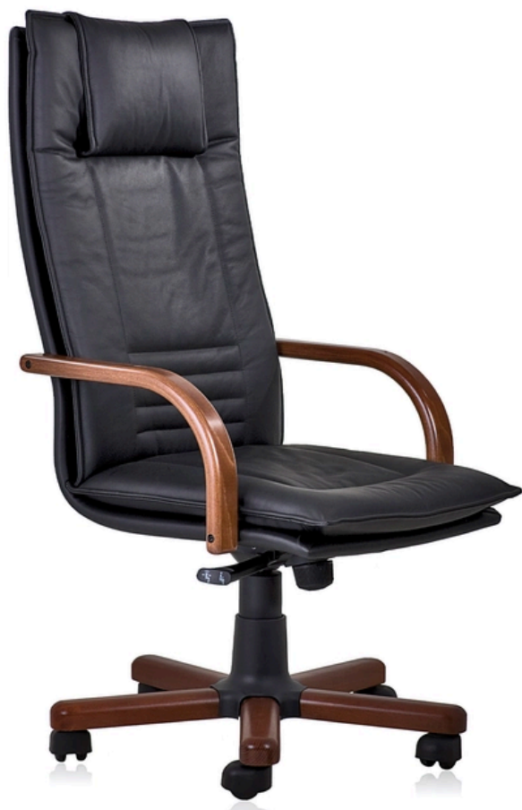
LA FOTO PUO' INCLUDERE OPTIONAL