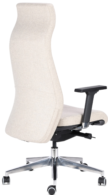
ITALIANS LESAC 900